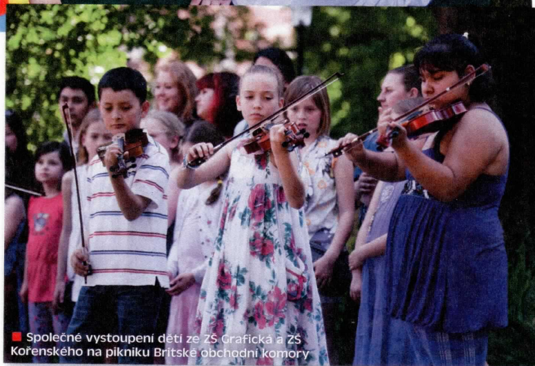
■ Společné vystoupení dětí ze ZŠ Grafická a ZŠ Kofenského na pikniku Britské obchodní komory

slza, nestyďte se! Říká se, že hudba je mocná čarodějka, a já vám tím odkazem nabídla důkaz! Když přišly na první koncert mámy těch „dětí-průkopníků“, nepoznávaly je. To-