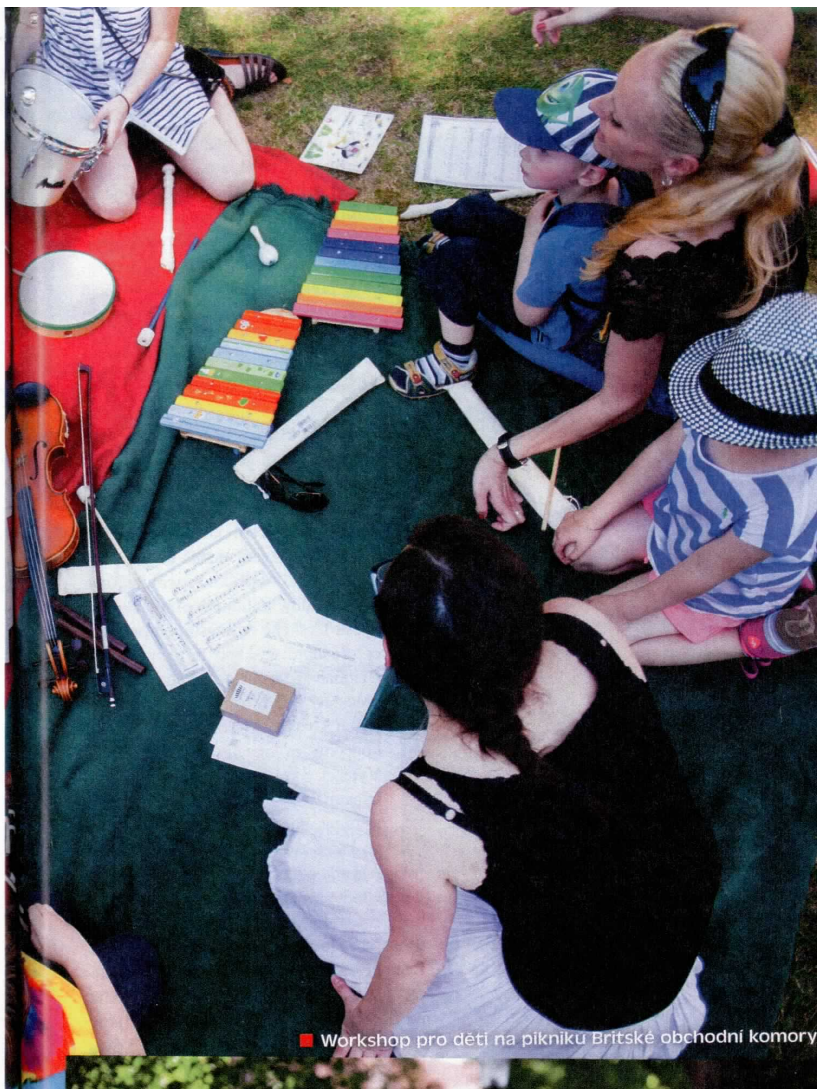
■ Workshop pro děti na pikniku Britské obchodní komory